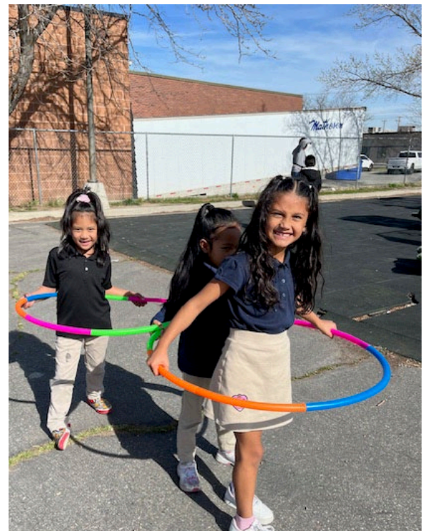
1 st grade students play with the new hula-hoops. Estudiantes de 1er grado juegan con los nuevos hula-hoops.